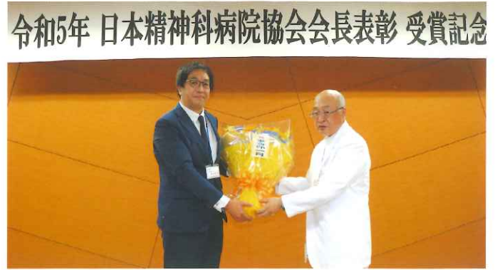
令和5年 日本精神科病院協会会長表彰 受賞記念