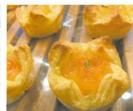
▲アップルカスタード