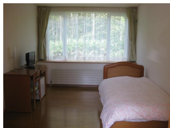
各室8畳以上で大きな出窓の広々とした居室