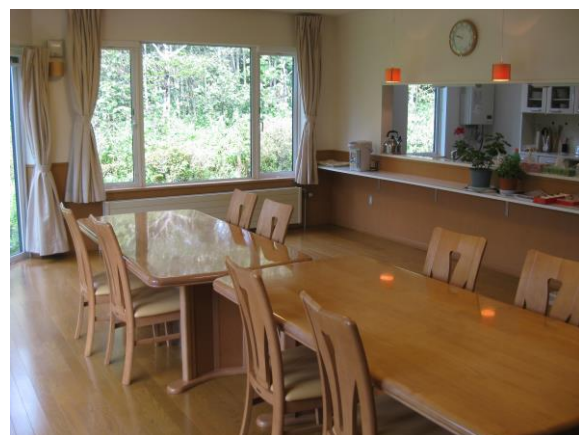
開放感あふれるリビング

スタッフ：管理者（作業療法士）・サービス管理責任者（精神保健福祉士） 世話人数名